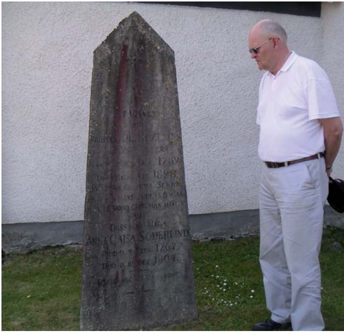
Artikelförfattaren vid graven i Vilske-Kleva