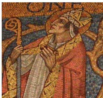
S:t Paulinus. Mosaik i St Michael's Church i Mytholmroyd

Han lyckades långt över de ställda förväntningarna och det berättas om hur tusentals människor kom till tro utefter vägen där han tog sig fram. Förmodligen var många av dem redan kristna sedan generationer tillbaka, kanske var det så att Rom ville befästa sitt inflytande över området på bekostnad av den keltiska eller iriska missionen. Ett sådant agerande är inte direkt främmande för oss i nord, med tanke på att den sydliga och västliga missionen tros ha tävlat med varandra även hos oss. Hur det nu än förhöll sig med olika kristna riktningar i norra England har Paulinus haft en oerhörd