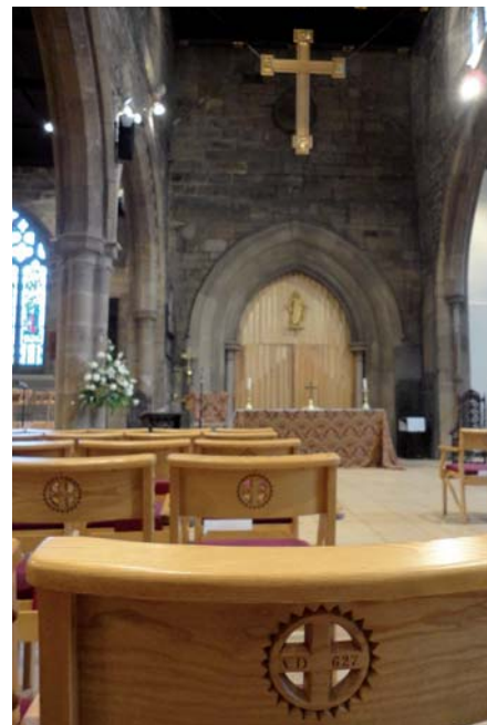
Fortida stenkors i Penninerna och nutida spår efter Paulinus i Dewsbury Minster, där pilgrimstanken ännu känns högst levande. I nära 1400 år har människor begivit sig hit, årtalet 627 finns inpräntat på de moderna stolsryggarna.

betydelse, vid sidan av andra nordengelska missionärer som exempelvis Columba, eller St Cuthbert (mest förknippad med Durham och Lindisfarne). I England finns fler skriftliga källor bevarade, vilket har gjort det mer fruktbart att forska i missions-historien - Paulinus finns omnämnd av Bede. Det är dock helt nyligen som andra spår har satts i samband med Paulinus verksamhet. I en liten stad i Penninerna i västra Yorkshire, började lokala historiker fundera över funktionen för de stenkors som finns utplacerade med visst avstånd, ofta på oländiga platser. Det har senare visat sig att åldern på dessa kors kan ha sammanfallit med Paulinus verksamhet. Dessa nya rön gav inspiration inte bara till en bok i ämnet utan också tankarna på en vandring i Paulinus fotspår. Tre år tog förberedelserna, i slutet av augusti 2011 påbörjades en veckolång pilgrimsvandring tvärs genom Yorkshire med York Minster som slutmål.