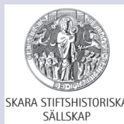
SKARA STIFTSHISTORISKA SÄLLSKAP